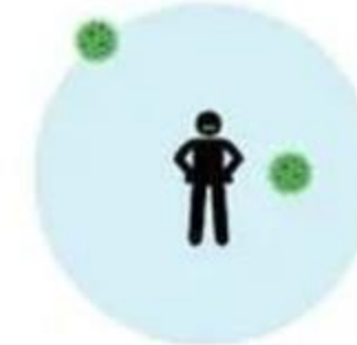
Gripe estacionaria 1,2-2,4

Cada persona con Sarampión puede contagiar entre 12 a 18 personas susceptibles (sin vacunación o con vacunación incompleta)