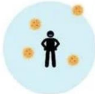
Gripe A (2009) 1,4-3,5